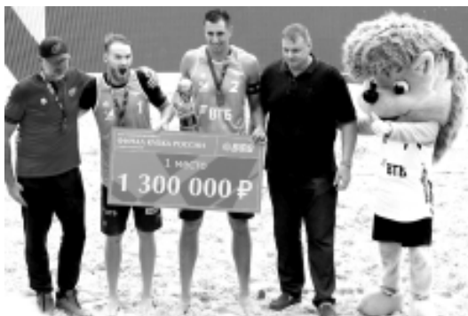
Репортаж Арсения Глазунова и Фёдора Кислякова (фото)

Три команды ЖВК «Локомотив», успешно преодолев групповой этап, поединки одной восьмой и четвертьфинала плей-офф, добились права в заключи-