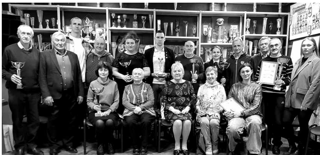
Групповой снимок представителей сборных вузов – победителей и призёров спартакиады «Здоровье-2025».