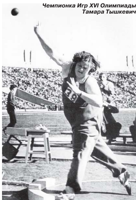
Чемпионка Игр XVI Олимпиады Тамара Тышкевич

случается с юными спортсменами, особенно резких взлётов, после которых иной раз следует длительный застой. Медленно, но верно повышала она результаты в метании копья, диска, прибавляя по полметра, метру. Ещё спокойнее росли результаты в толкании ядра – здесь «прибавка» измерялась уже не метрами, а десятками и даже единицами сантиметров. В шестнадцатилетнем возрасте она установила свой первый всесоюзный рекорд – рекорд для девушек в метании копья – 32 м 39 см. Произошло это снова во время соревнований на первенство спортивной школы. Через несколько дней на соревнованиях школьников Зыбина установила всесоюзный рекорд для девушек в метании диска – 32 м 27 см.