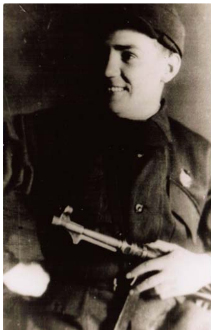
В.Д. Шапошников

лись спортсмены и даже отдельные отряды спортсменов. Нам пришлось встретиться с подобным фашистским отрядом.