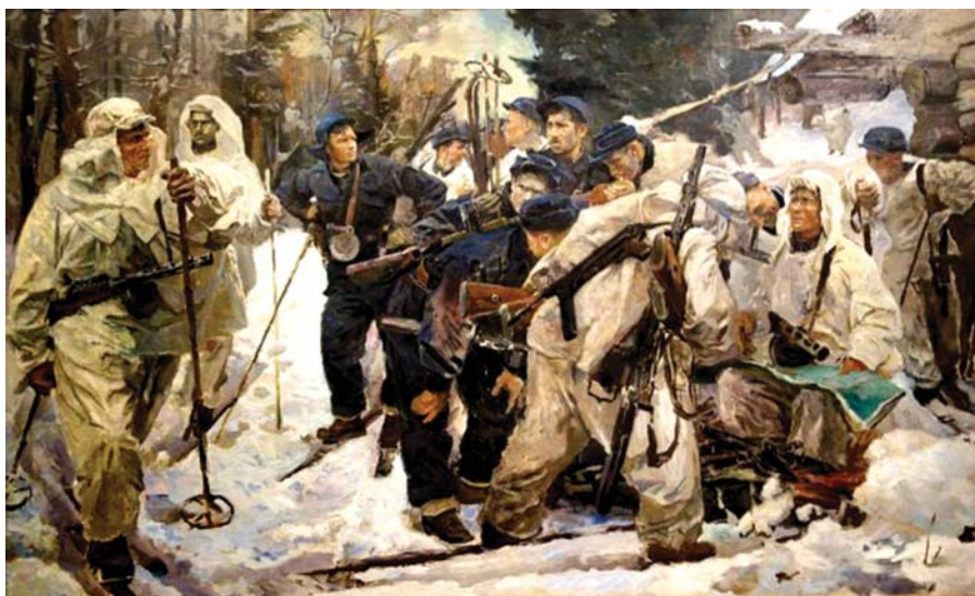
Репродукция с картины художника И.А. Серебряного «Партизанский отряд» (Лесгафтовцы), 1942 г.

Видя, как фашистские полчища рвались к Ленинграду, бойцы-партизаны дрались, не жалея сил и жизни. Спортивная закалка, смелость, выносливость делали бойцов наших отрядов отличными воинами. Наши отряды наводили ужас на фашистских захватчиков. Хорошая маневренность позволяла нам появляться в самых неожиданных для противника местах.