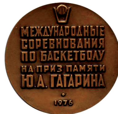
6. аверс и реверс