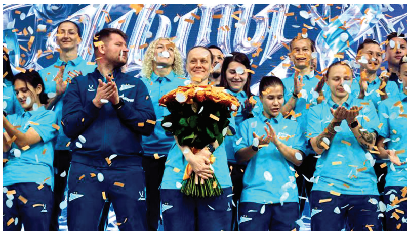
14 марта. Представление ЖФК «Зенит» в сезоне-2026